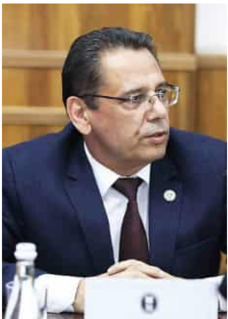
Олий таълим, фан ва инновациялар вазири Конгратбай Шарипов Ўзбекистонда хусусий университетларга лицензия бериш тўхтатилганини маълум қилди.

Вазир сўнги бор хусусий университетларга лицензия 2023 йил октябрда берилганини айтиб, буни таълим сифати ва ишсизлик билан боғлади.