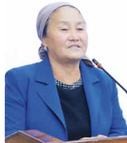
Бибихан УТАМБЕТОВА, Қорақалпоғистон Республикаси Жўқорғи Кенгеси депутаты, ЎзХДП фракцияси аъзоси:

Сўнгги йилларда мамлакатимизда ер ва мулкка ёндашувлар бутунлай ўзгарди, хусусий мулк дахлсизлигини таъминлаш бўйича катта амалий ишлар қилинди. Лекин ердан инвестиция сифатида фойдаланиш тизими ҳали орқада экани кўрсатиб ўтилди.