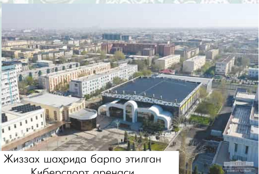
Жиззах шаҳрида барпо этилган Киберспорт аренаси