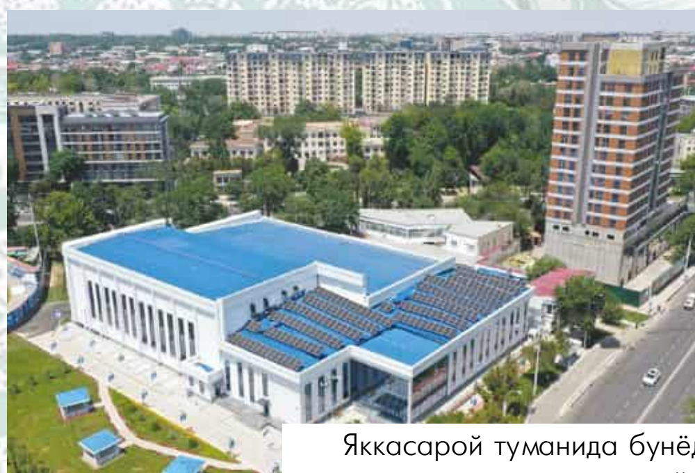
Яккасарой туманида бунёд этилган сув спорти саройи