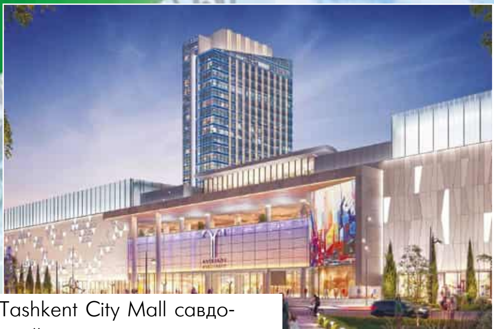
Tashkent City Mall savdo- kўngilochar markazi