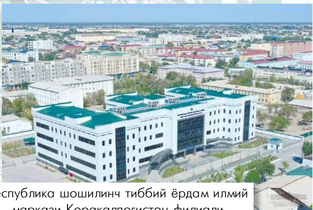
Республика шошилич тиббий ёрдам илмий маркази Қорақалпоғистон филиали