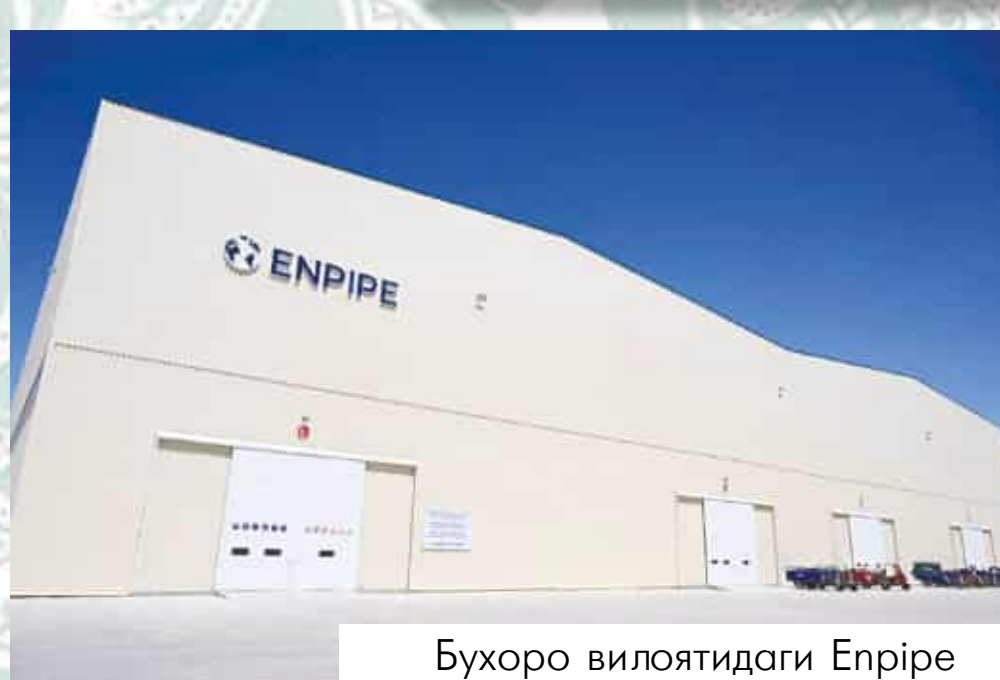
Бухоро вилоятидаги Enpipe корхонаси