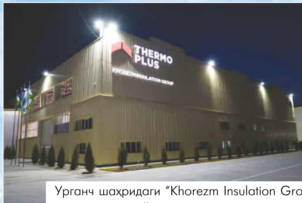
Урганч шаҳридаги "Khorezm Insulation Group" қўшма корхонаси