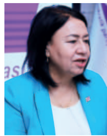
Шарбат АБДУЛЛАЕВА, иқтисод фанлари доктори, профессор, Марказий Кенгаш аъзоси:

–Мустақиллик билан тенгдош бўлган партиямиз давлатимизнинг бугунги тараққиётига, демократик кадрларни мустаҳкамлаш, кучли фуқаролик жамиятини қарор топтиришга муносиб ҳисса қўшди, деб бемалол айта олам.