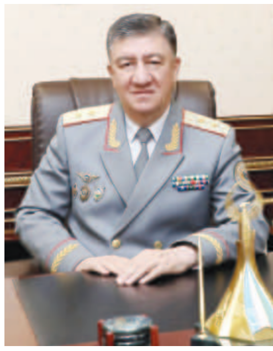
Пўлат БОБОЖОНОВ, Ўзбекистон Республикаси ички ишлар вазири, генерал-лейтенант:

— ПРЕЗИДЕНТИМИЗ ИЛГАРИ СУРГАН “ХАЛҚ ДАВЛАТ ИДОРАЛАРИГА ЭМАС, ДАВЛАТ ИДОРАЛАРИ ХАЛҚИМИЗГА ХИЗМАТ ҚИЛИШИ КЕРАК”, ДЕГАН ЭЗГУ ҒОЯ МАМЛАКАТИМИЗ ИЧКИ ИШЛАР ОРГАНЛАРИ ТИЗИМИДАГИ ТУБ ИСЛОҲОТЛАР НЕГИЗИНИ ТАШКИЛ ЭТАДИ. ХУСУСАН, ИСЛОҲОТЛАРНИНГ БИРИНЧИ БОСҚИЧИДА ИЧКИ ИШЛАР ОРГАНЛАРИНИНГ ТУЗИЛМАСИ МАҚБУЛЛАШТИРИЛИБ, БАРЧА БЎҒИН РАҲБАРЛАРИНИНГ ХАЛҚ ДЕПУТАТЛАРИ МАҲАЛЛИЙ КЕНГАШЛАРИ ВА ОЛИЙ МАЖЛИС СЕНАТИ ОЛДИДА ҲИСОБДОРЛИГИ БЕЛГИЛАНДИ. ШАХСИЙ ТАРКИБНИНГ 85 ФОИЗИ ҚҲҲИ БЎҒИНГА ТУШИРИЛИБ, РАҲБАР ҲАМДА МАСЪУЛ ХОДИМЛАРНИНГ ХАЛҚ БИЛАН БЕВОСИТА МУЛОҚОТ ҚИЛИШИ ЙЎЛГА ҚҲҲИЛДИ.