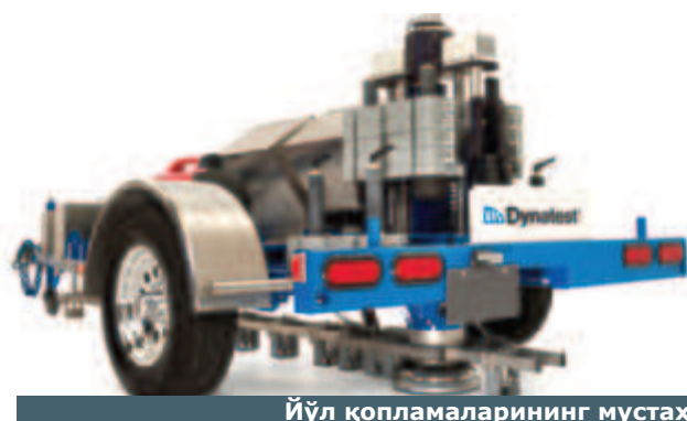
Йўл қопламаларининг мустаҳкамлигини ўлчаш тизими