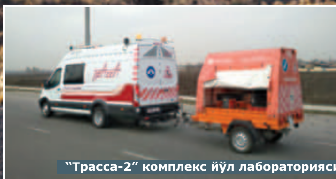
"Трасса-2" комплекс йўл лабораторияси ва унинг тизимлари