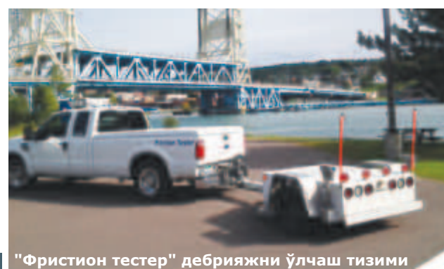
"Фристон тестер" дебрижни ўлчаш тизими