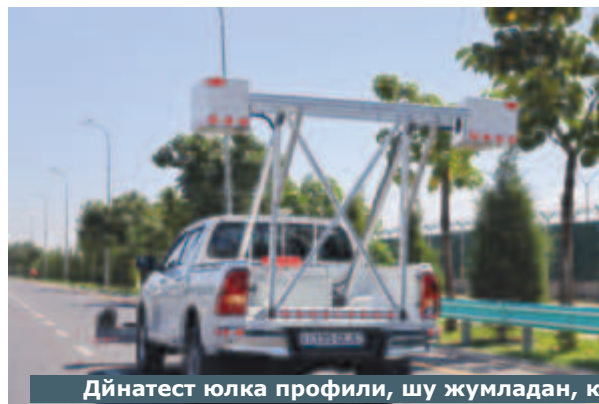
Дйнатест юлка профили, шу жумладан, кўп функцияли автомобиль вариантлари

Ҳозирги вақтда мамлакатимиз Транспорт вазирлиги ҳузурида Автомобиль йўллари қўмитасининг Автомобиль йўллари-