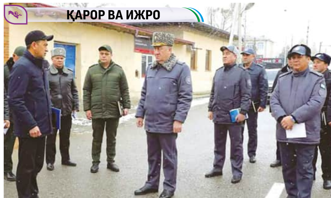
ҚАРОР ВА ИЖРО