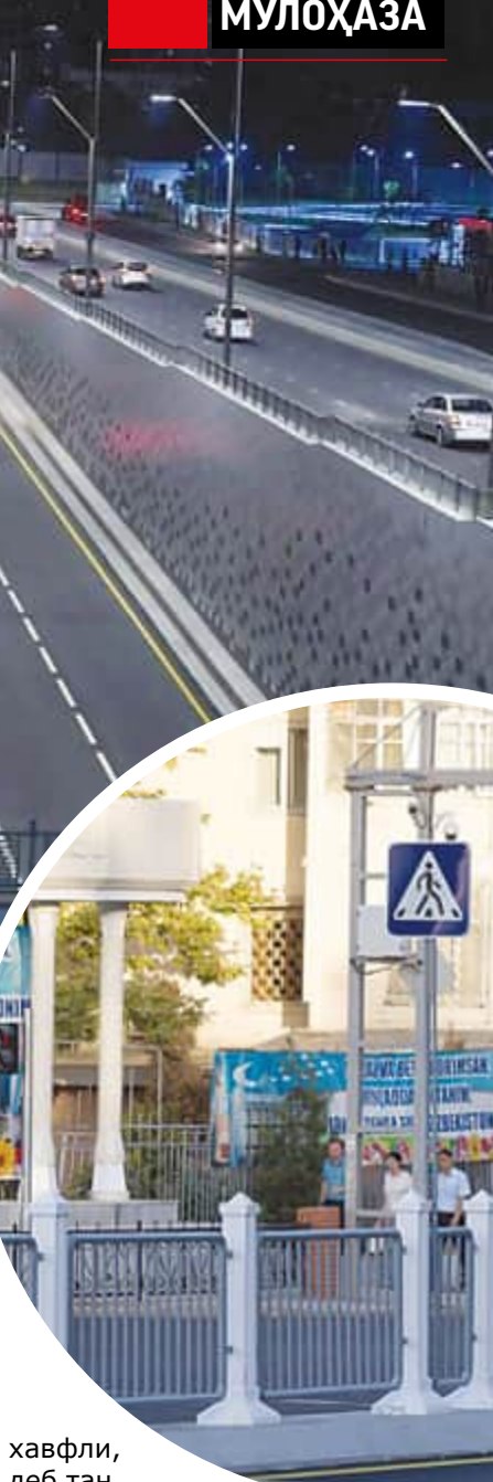
хавфли, деб тан олинган амалиётга қайтиб, Мирзо Улугбек кўчасида янги панжаралар ўрнатилди, кейин бир